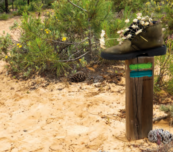
Trekking im Portogallo, Rota Vicentina

01 ■ Salita al Rifugio Bozano , Valle Gesso, MONDOVÌ, Alpinismo Giovanile, I. Bovololo, G. Ghiazza.