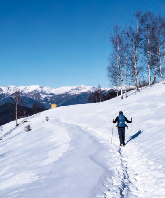
Pilone di Rocca Stella, Valle Grana