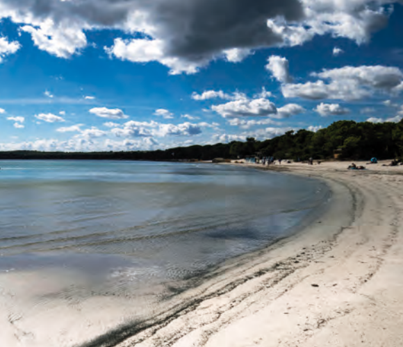
Spaggia di Pinarello, Sud Corsica

31 ■ Escursione al Monte Cordona da Sori , Appennino Ligure, SAVONA, L. Remotti, O. Paterniti.