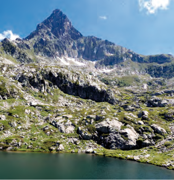
Lago Inferiore del Frisson, Valle Vermentagna