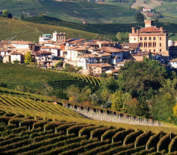
Barolo a inizio autunno, Langhe