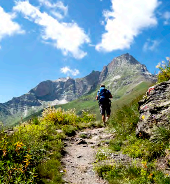
Verso il Pelvo d'Elva, Valle Maira

07 ■ Rafting in Valle Stura , SALUZZO, Alpinismo Giovanile, G. Galliano, L. Costamagna.